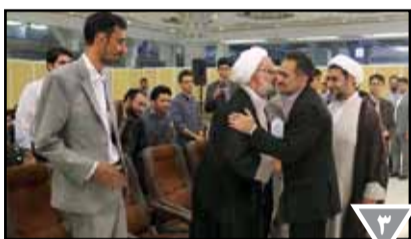
رونمایی از نرم افزار «مشکات» مجموعه آثار علامه مصباح یزدی (حفظه...)