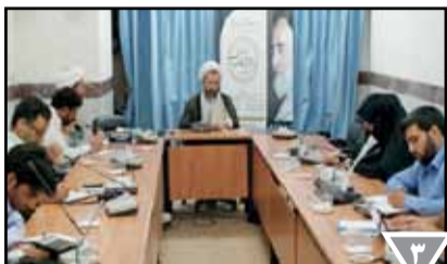
برگزاری اولین همایش بین المللی «اندیشه های علامه طباطبائی در تفسیر المیزان»