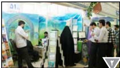
گزارشی اجمالی از حضور مؤسسه در نمایشگاه قرآن کریم